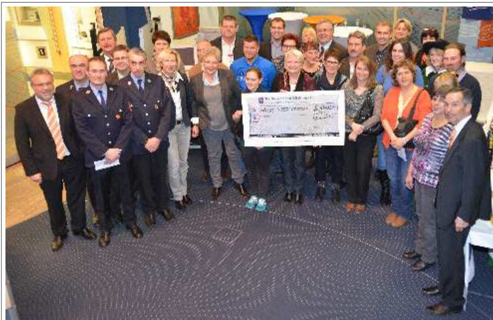
Bild der Spendenempfänger bei der Übergabe durch unseren Vorstand

Wieder einmal haben 24 Institutionen in Gilching, welche sich der Jugendförderung oder sozialen Zwecken widmen, Spenden in Gesamthöhe von 17.400,-- € entgegen nehmen dürfen. Da die Raiffeisenbank Gilching als selbständiges Institut nur in Gilching